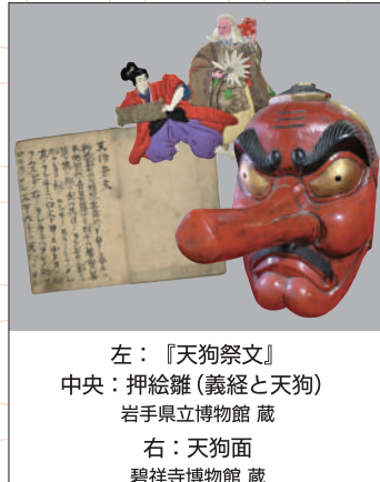
左：『天狗祭文』 中央：押絵雛(義経と天狗) 岩手県立博物館 蔵 右：天狗面 碧祥寺博物館 蔵