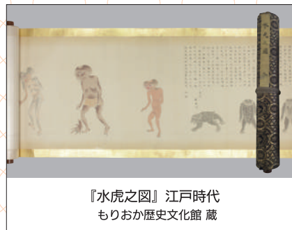
『水虎之図』江戸時代 もりおか歴史文化館 蔵