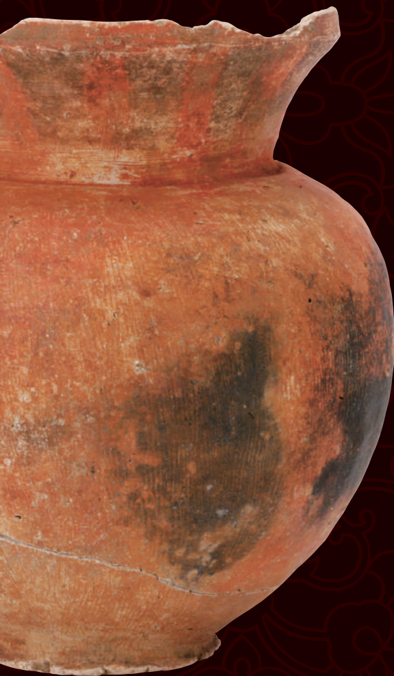
宮古市津軽石大森遺跡 壺 岩手県蔵