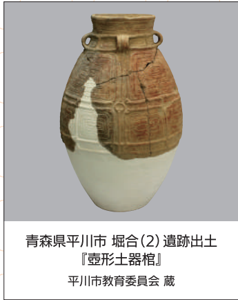
青森県平川市 堀合(2)遺跡出土 『壺形土器棺』 平川市教育委員会 蔵