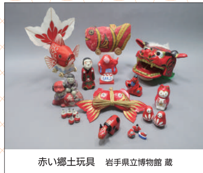
赤い郷土玩具 岩手県立博物館 蔵