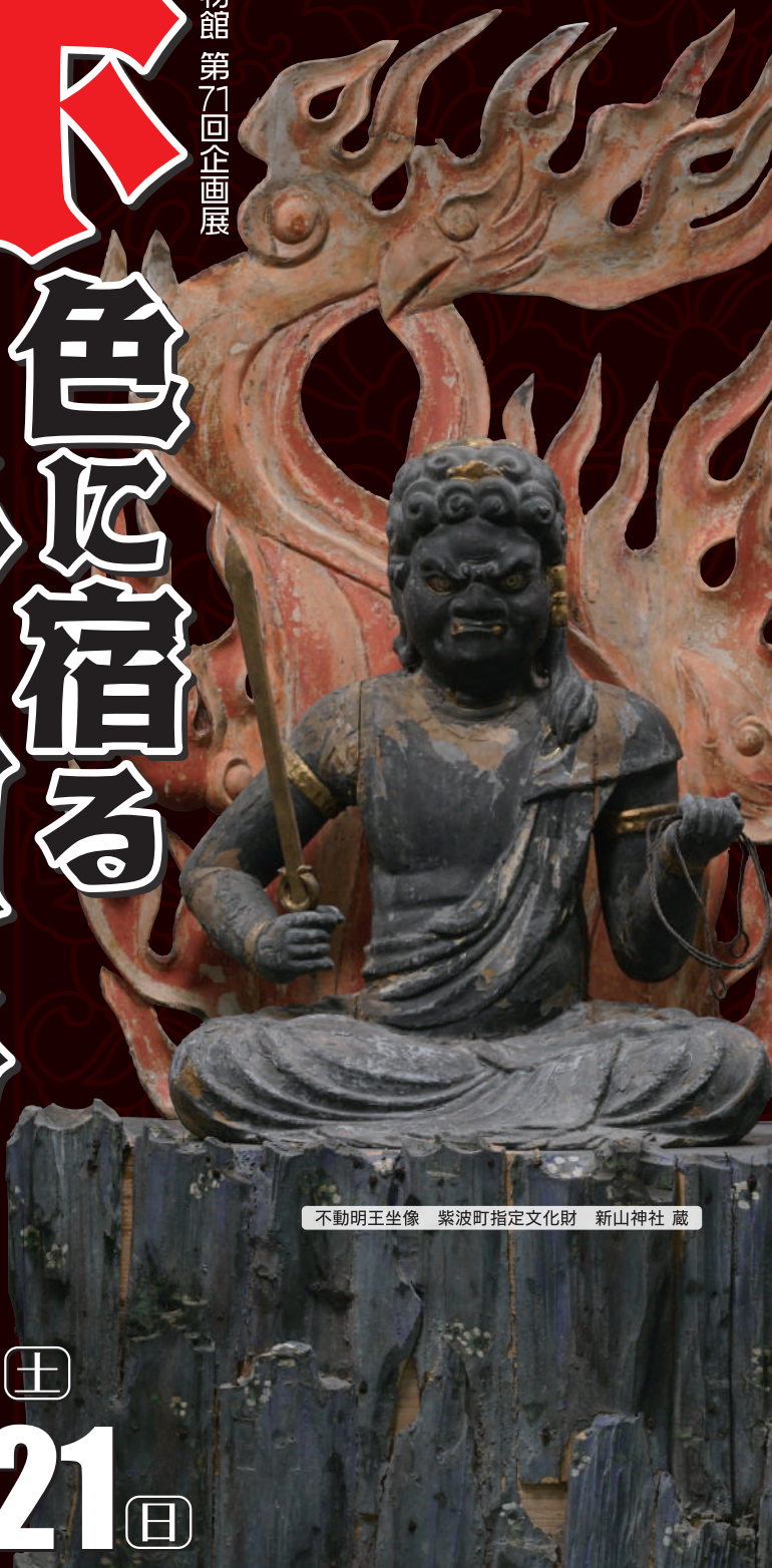
不動明王坐像 紫波町指定文化財 新山神社 蔵