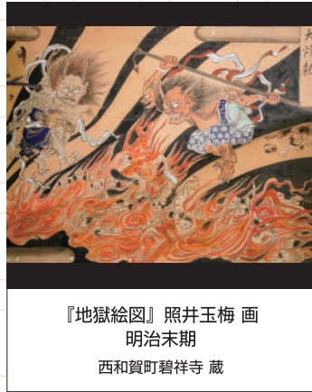
『地獄絵図』照井玉梅 画 明治末期 西和賀町碧祥寺 蔵