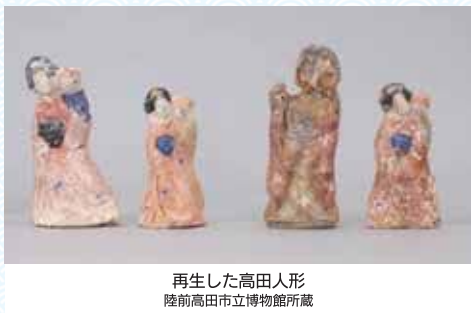
再生した高田人形 陸前高田市立博物館所蔵