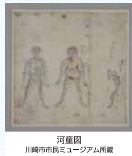
河童図 川崎市市民ミュージアム所蔵