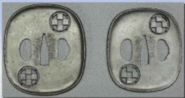
「丸に石畳紋透し鉢(大小)」