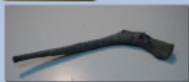
種市川のクビナガリョウ動物化石