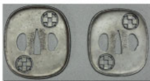
「丸に石畳紋透し鐔（大小）」

岩手県指定文化財の刀のつば「丸に石畳紋透し鐔」は、盛岡藩お抱え御師の作品です。伝高野長英筆「旁訳洋文解」草稿は、フランス語の医学書を筆写し、朱書きで日本語を書き添えたものです。世界初の電子計算機は、現在のシャープが1964年7月に発売し、重量25kg、価格は53万円で、当時は乗用車と同様大変な高級品でした。