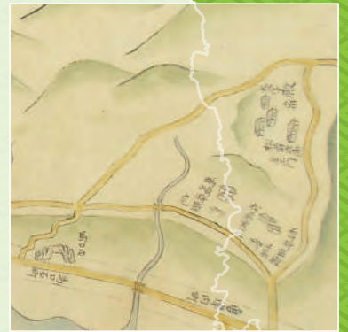
『久保田・弘前城下絵図綴本』(館蔵)より