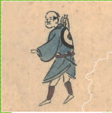
『参勤行列図巻』(館蔵)より