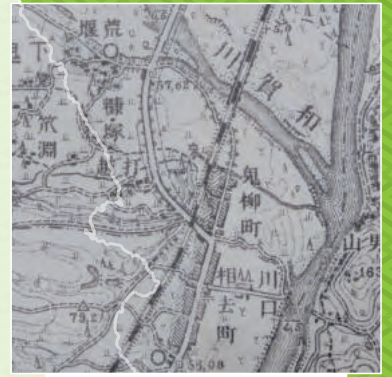
『黒澤尻・五万分一地図』(館蔵)より