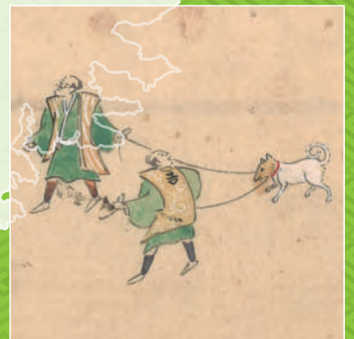
『参勤行列図巻』(館蔵)より

この8枚の資料は岩手県立博物館の所蔵品の一部分、もしくは当展覧会担当者が撮影したものです。展示資料としてごみが出ていますので、是非探してみてください。