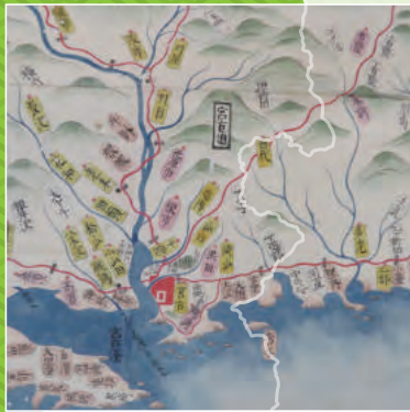
『盛岡藩領内図』(館蔵)より