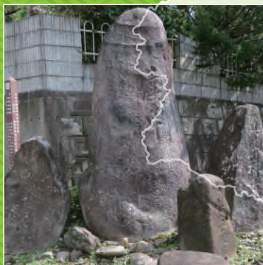
『道標・供養碑 砂溜』