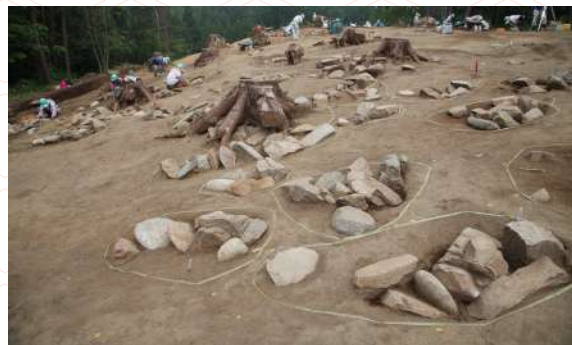
配石遺構