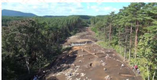
西平内 I 遺跡遠景