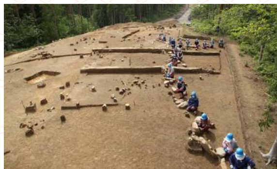
環状列石の全景