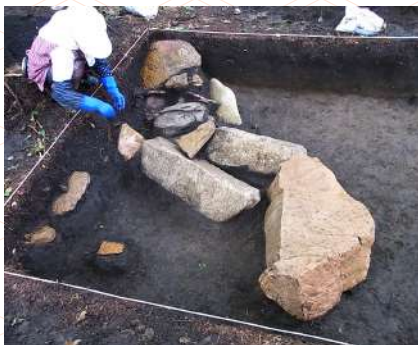
令和2年度調査の様子