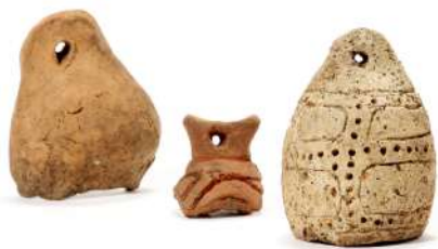
鐸形土製品

縄文時代後期の初めから晩期 (今から 3,000~4,000 年前) にかけて、 北海道や北東北各地につくられた謎の多い環状列石。太平洋岸で初めて その存在が確かめられた洋野町西平内 I 遺跡の調査結果を中心に、石に まつわる岩手の縄文遺跡を紹介します。