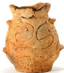
出土した土器