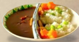
オリジナルダムカレー