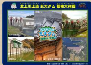
オリジナルダムカードプレゼント