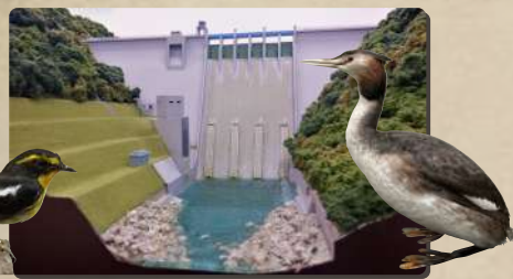
田瀬ダムジオラマ模型