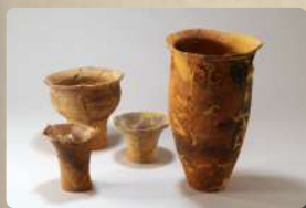
大清水上遺跡 土器