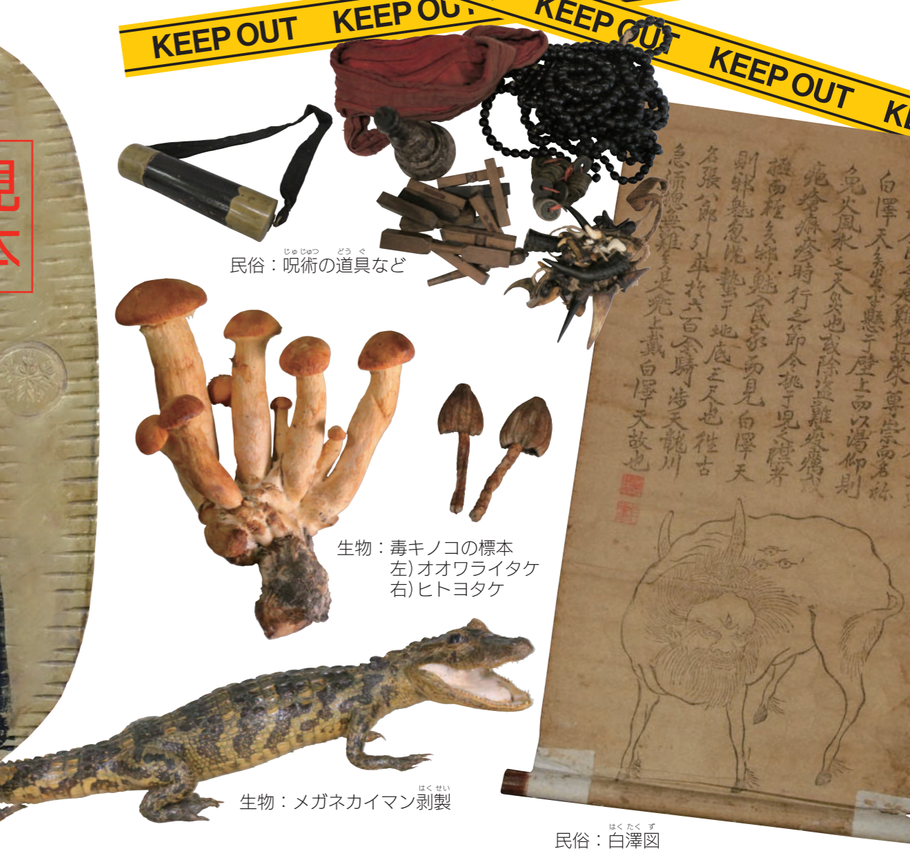
見本 実寸大! 民俗：呪術の道具など 生物：毒キノコの標本 左) オオワライタケ 右) ヒトヨタケ 生物：メガネカイマン剥製 民俗：白澤図