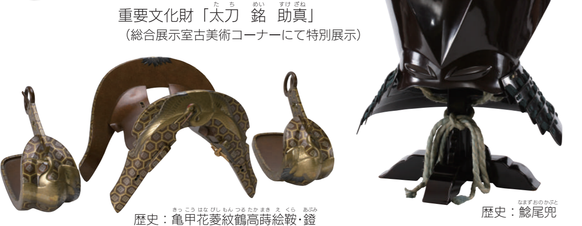
重要文化財「太刀 銘 助真」 (総合展示室古美術コーナーにて特別展示) 歴史：亀甲花菱紋鶴高時絵鞍・鏡 歴史：鯨尾兜