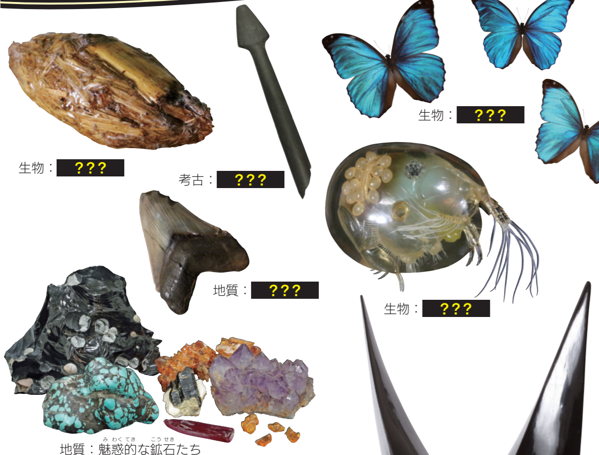
生物：??? 考古：??? 地質：??? 生物：??? 地質：魅惑的な鉱石たち