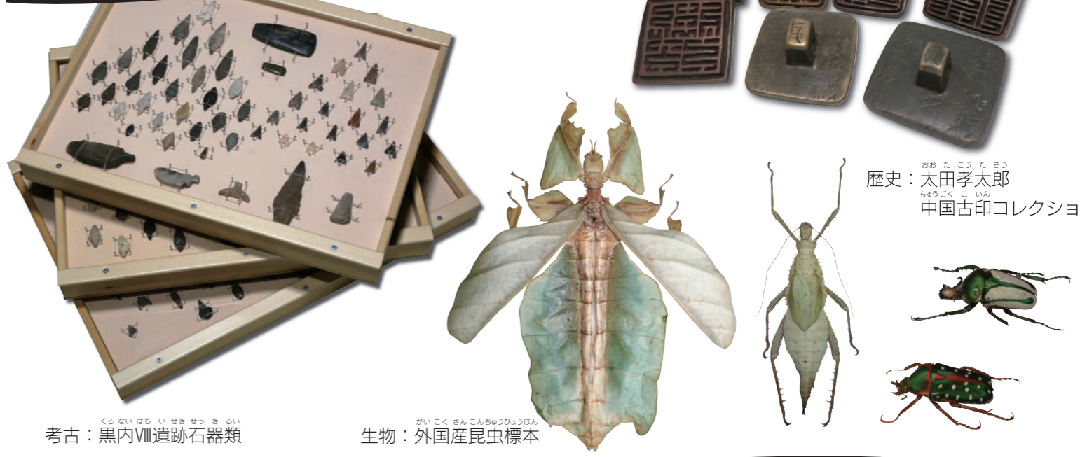
考古：黒内VIII遺跡石器類 生物：外国産昆虫標本 歴史：太田孝太郎 中国古印コレクション